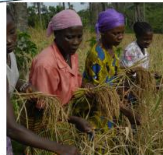
Llun: Aubrey Wade/Oxfam 2012